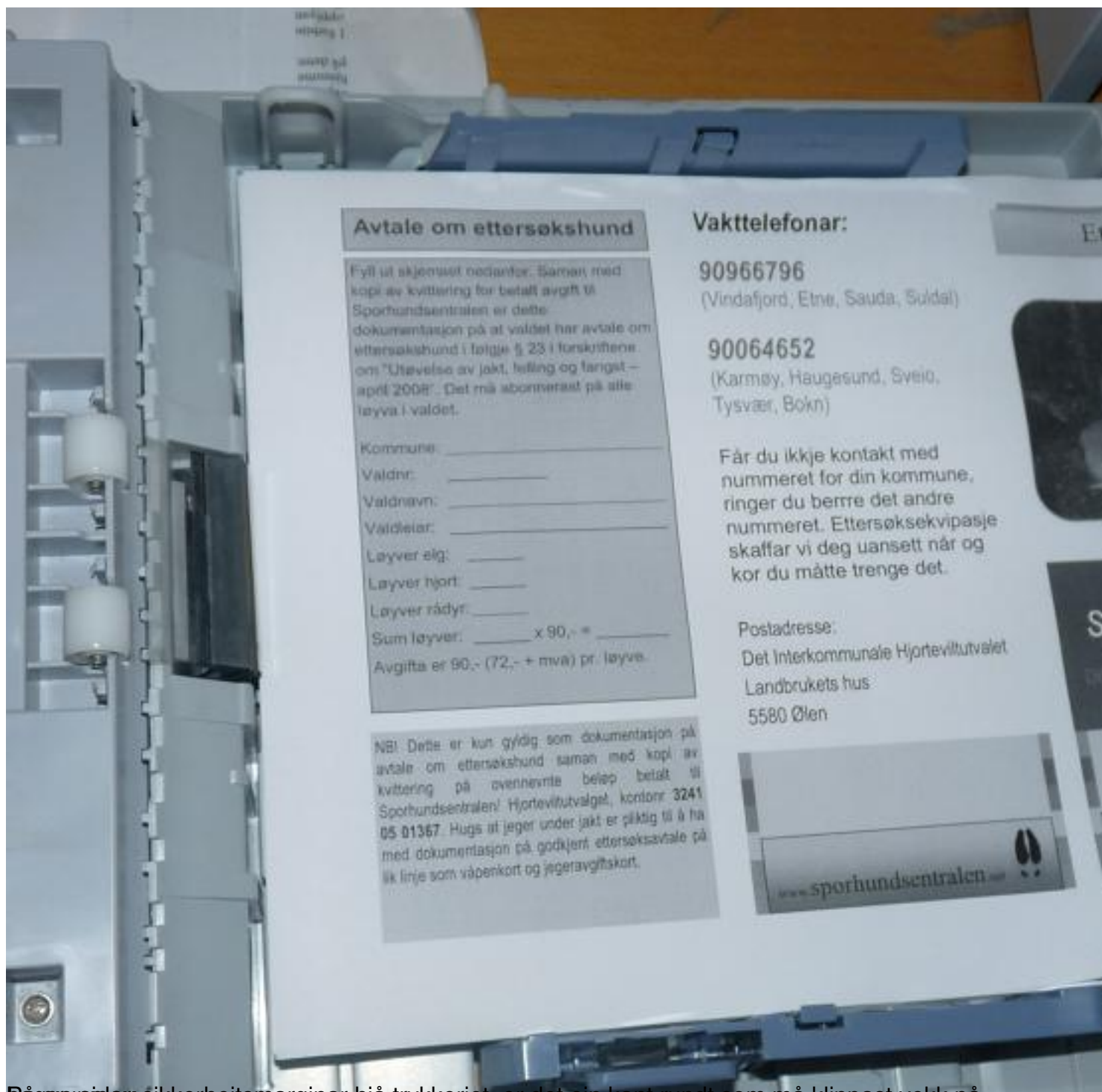
Både på sider: sikkerhetsmarginar hjå trykkeriet, er det ein kant rundt som må klippast vekk på