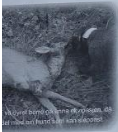
Va dyret berre ganna utvipsjen, då del med ein hund som kan sleppast.

eller ikkje noko funn i det hele tatt, e er i tvil, ring vaktelefonen og bli s det er best å fortsette. hund som ikkje er trent og